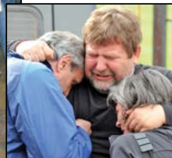
Те искат справедливост...

убийство в центъра на столицата до Съдебната палата. Той посочи, че никой от управляващите досега не е поел отговорност. „Отново виждаме замесени хора от висшите ешалони на властта, което показва, че хо-