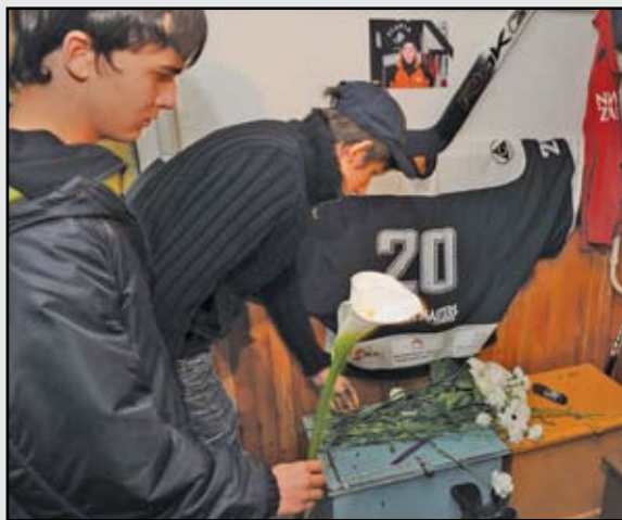
В тази съблекалня никога вече няма да е същото...