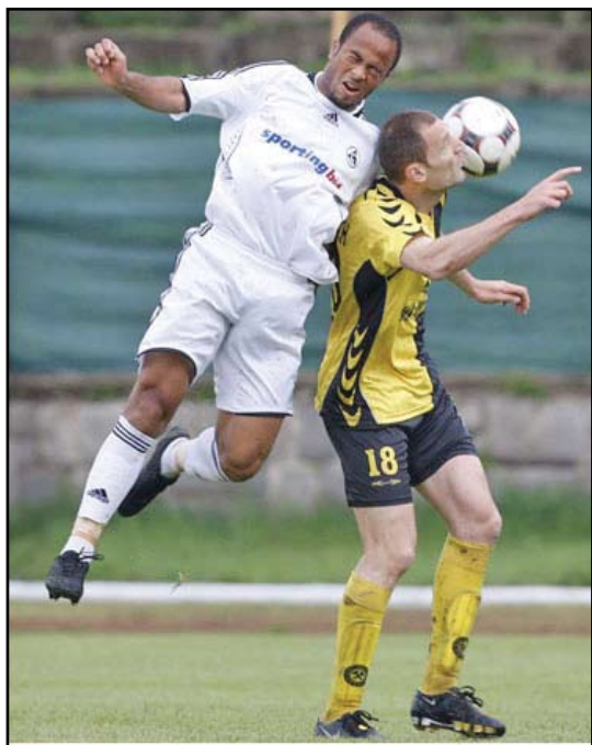
„Белите“ пак не надскочиха себе си, но имат шанс за достоен завършек на сезона – победи в столицните дербита

Легендарният плеймейкър на българския национален отбор по футбол и „Щутгарт“ Красимир Балъков тотално промени играта на своя тим. Бургазлии победиха европретендента „Литекс“ с 3:1 и загубиха от ЦСКА с минималното 0:1 в доста съмнителен двубой. Най-култовият играч на отбора от Бургас Мишел Платини реализира хеттрик за успеха с 3:0 срещу борещия се за спасение тим