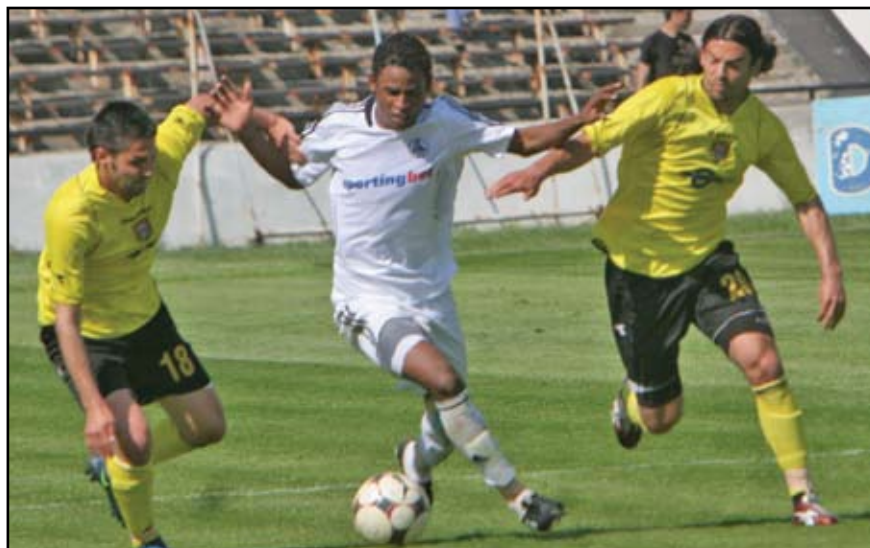
Привържениците на "Славия" искат да виждат своите любимци борещи се до край за победата и честта на клуба