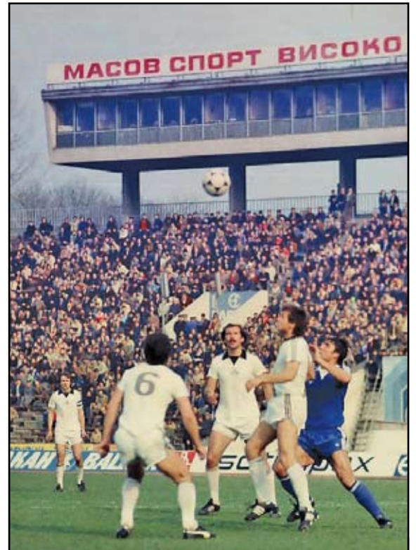
Най-старото родно дерби има вече почти вековна история. Десетилетия наред двубоят между "бели" и "сини" определя дневния ред в българския футбол. Макар и избледнял в последните години сблъсъкът между "Славия" и "Левски" има своето очарование и днес.

Основните акценти за най-старото дерби през годините на стр. 8-9