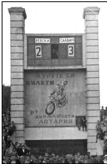
беди. Редица срещи са по-скоро протоколни,

Най-много мачове "Славия" и "Левски" записват на ниво "А" група. Елитната ни дивизия е сформирана през есента на 1948 година. Дълго време дерби мачовете са много равностойни и до пролетта на 1982 година, "белите" имат само три победи по малко от своя съперник! В последвалите десетилетия балансът е влошен значително. Особено сериозен е "приносът" на последните 20 години. За 42 изиграни мача в този период славистите взимат едва 3 по-