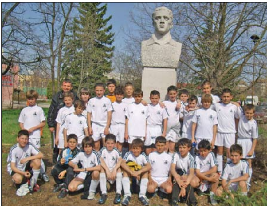
След победата над връстниците им от "Левски" с 2:1 гордите млади слависти строени пред монумента на Димитър Благоев (Палъо)

и горди се снимат след мача пред монумента на първия председател.