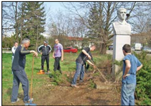
Тече усилена работа по почистване на паметника