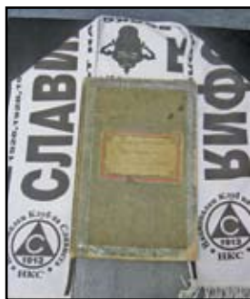
“Бялата библия” вече е и осветена

На тези, които преди 96 години създадоха първия истински организиран и подреден според законите на страната футболен клуб. На тези, които измислиха великото име “Славия” и писаха девет години 200-те страници на Първата протоколна книга на “белите”. На тези, които носиха с чест бяла-