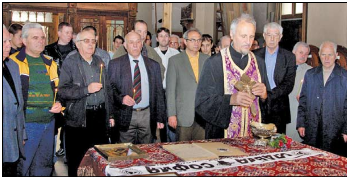
Слависти от три поколения изпълниха храма “Св. Георги” при освещаването на “Бялата библия”

му и първите години от съществуването му. Документът, който се озова на “Овча купел” след куп перипетии и случайности миналата година, е уникален по рода си. Той дава право на славистите да претендират, че именно те, а не “Черно море” или “Ботев” (Пловдив) например са най-ста-