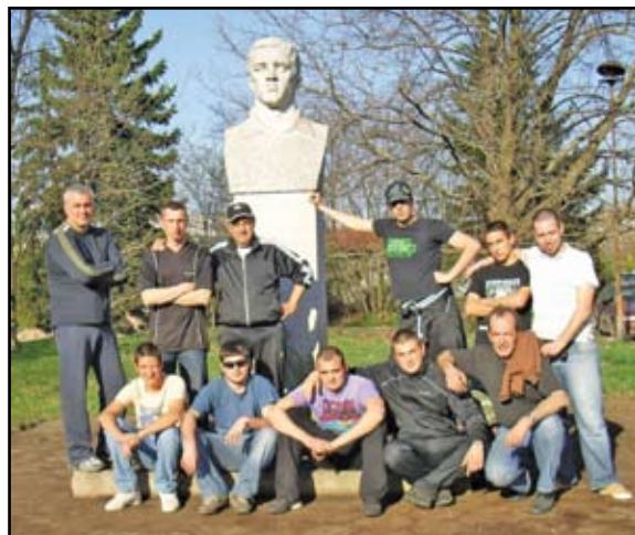
Истински обичащи своя клуб тези редови слависти върнаха достойния вид на паметника на първия председател

правят нещо за своя бележит предшественик. Крайно време е пространството около паметника да се превърне в кокетна градинка с пейки и алеи. За да стане това място любим кът на всички слависти, които идват на някое от спортните мероприятия случващи се в спортния комплекс "Славия". Ние от вестника, а и всички слависти за пореден път информираме ръководителите за нещо, което е тяхно задължение, но е оставено на произвола на съдбата