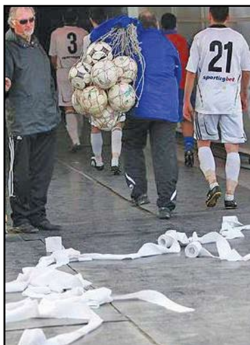
След края на двубоя някои от крайните привърженици на „белите“ демонстративно замериха своите с тоалетна хартия

Съмненията за нещо нередно около двубоя се потвърждават с пълна сила