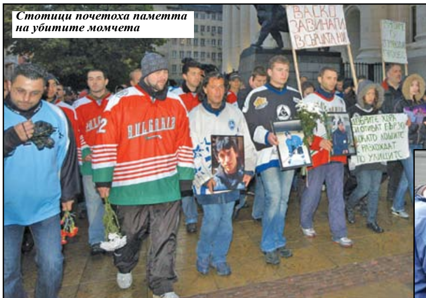
Стотици почетоха паметта на убитите момчета

убийство в центъра на столицата до Съдебната палата. Той посочи, че никой от управляващите досега не е поел отговорност. „Отново виждаме замесени хора от висшите ешалони на властта, което показва, че хо-