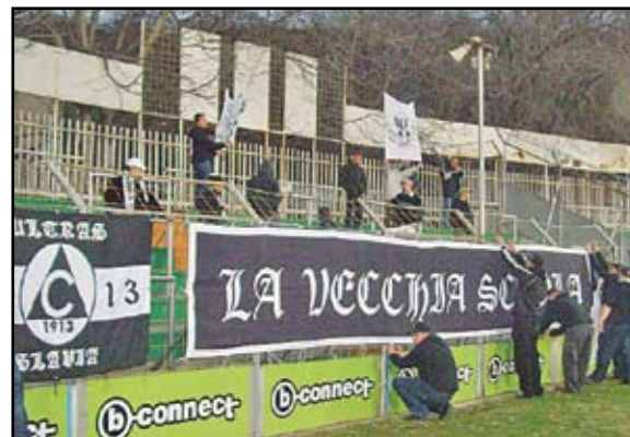
Членовете на фракцията не пропуснаха гостуването на „белите” и в Ловеч