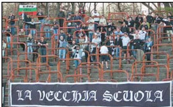
LVS и „BoyS Sofia” подкрепяха тима до последно и неколкратно заглушиха феновете на „червените” на собствения им стадион

по безброй начини, както на трибуните, така и в много други аспекти свързани пряко или косвено с любими отбор. В момента фракцията наброява над трийсет души. Както всяка улtras-организация и тук има ясно обособено ядро от лидери, които се стремят да допринесат за развитието и повишаването на фенската културата сред „бели-